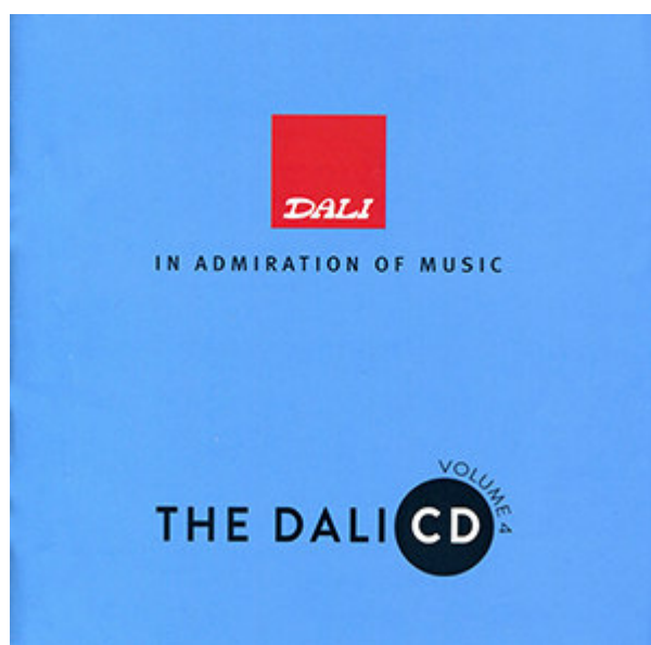
Dali CD Volume 4

幾經比對，我決定用平衡連接，因為在我的聆聽系統，用平衡時的音場層次感、分離度都明顯更好，結構也更清楚。至於訊源則是一台 Windows 10 筆記型電腦，透過 USB 線連接 S3（S3 也備有 USB DAC 功能）。喇叭則是我的 Aurum Cantus Grand Harmony 喇叭。試聽所用的參考軟體主要是「Dali CD Volume 4」，這是一張非常好用的測試片，所選的曲目不僅好聽，而且涵蓋各種音樂類型與錄音特色，包括古典、爵士、鄉村、電影配樂、流行，甚至是電子樂，可以藉以了解系統各方面的表現力。